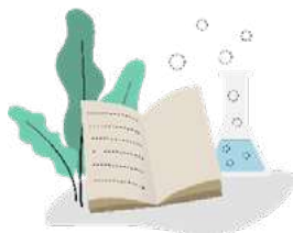
Enseignement & Recherche