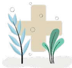
Santé & Bien-être

Tels sont les défis que relèvent nos life designers pour réussir à ne pas « faire comme avant » et pour proposer de nouveaux modes de fonctionnement et de création.