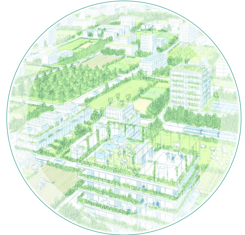
Scénario « Intégration », Martin Étienne, Prendre la Clé des Champs : Agriculture et Architecture , Sébastien Marot, 2019

Nous accompagnons les territoires et organisations (collectivités, entreprises, industries, institutions, associations et collectifs) à anticiper les risques systémiques, saisir les opportunités de transformation et se mettre collectivement en action pour renforcer notre résilience.