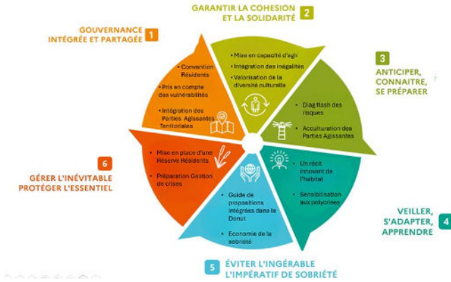
La boussole d'un habitat robuste et résilient