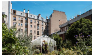
Pépinière Chanzy, Paris 11e