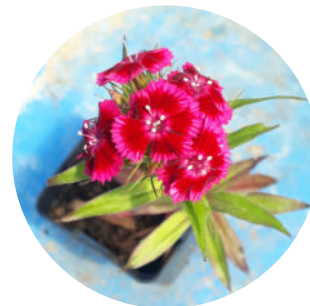
230 variétés en production Objectif de sortie : 8,000 plants en 2025