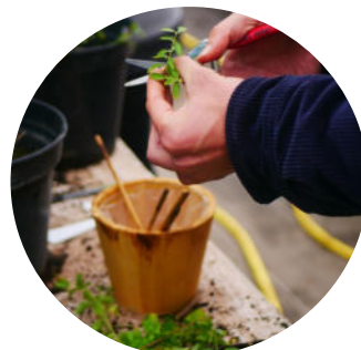
Une formation en juillet labellisée Travail et Transition