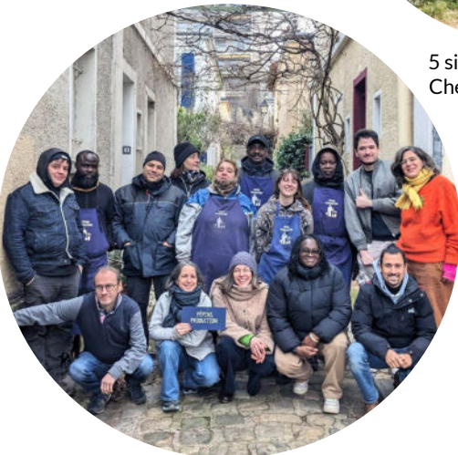
Chantier d'insertion de 10 personnes, qui participent à toutes les activités de l'association