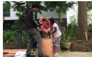
Jardin des Rigoles, Paris 20e