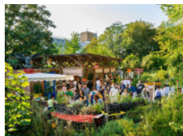
Jardins Passagers, Parc de la Villette