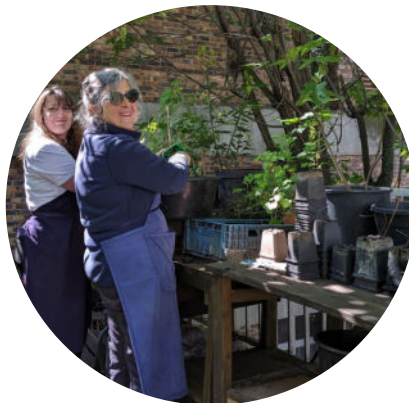
Chaque semaine, 4 créneaux d'ateliers gratuits pour multiplier les plants et apprendre le vivant