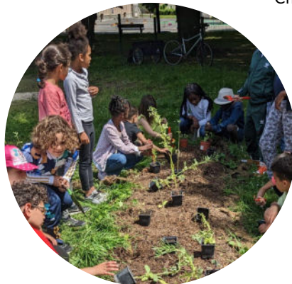
17 classes qui suivent un parcours de 6 ateliers jardinage et écologie et 9 partenaires sociaux