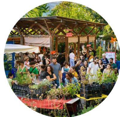
Un nouveau festival en préparation "des plantes et des hommes, une histoire de famille"