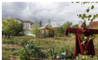
Pépinière cheminote, Chelles