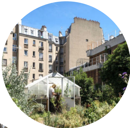
5 sites actifs à Paris, Chelles et Marseille