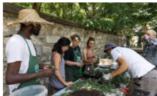
Flore Urbaine, Paris 20e