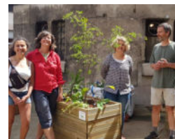
Plantations et ateliers