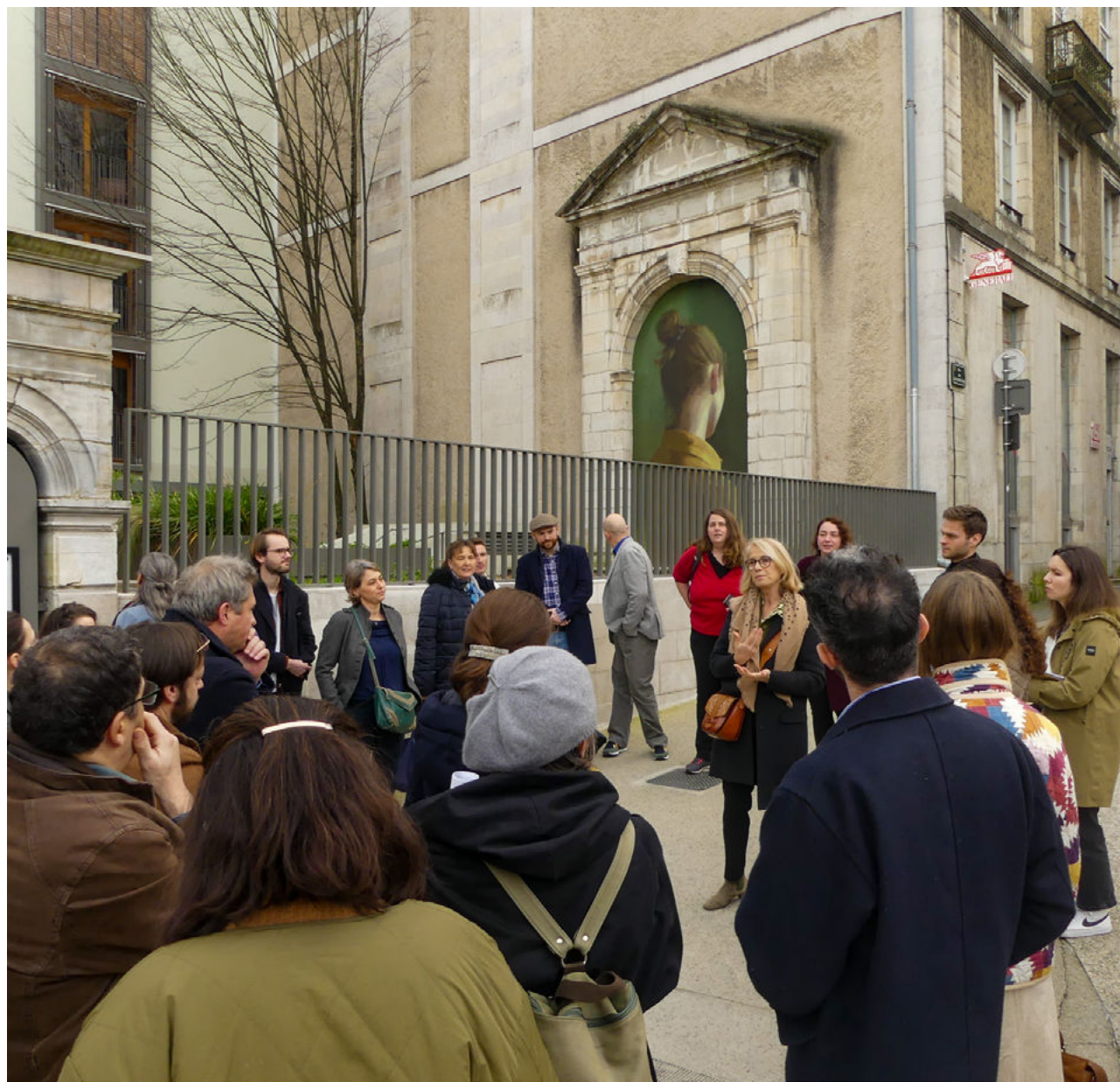
Groupe de travail à Bayonne (29 et 30 janvier 2024)