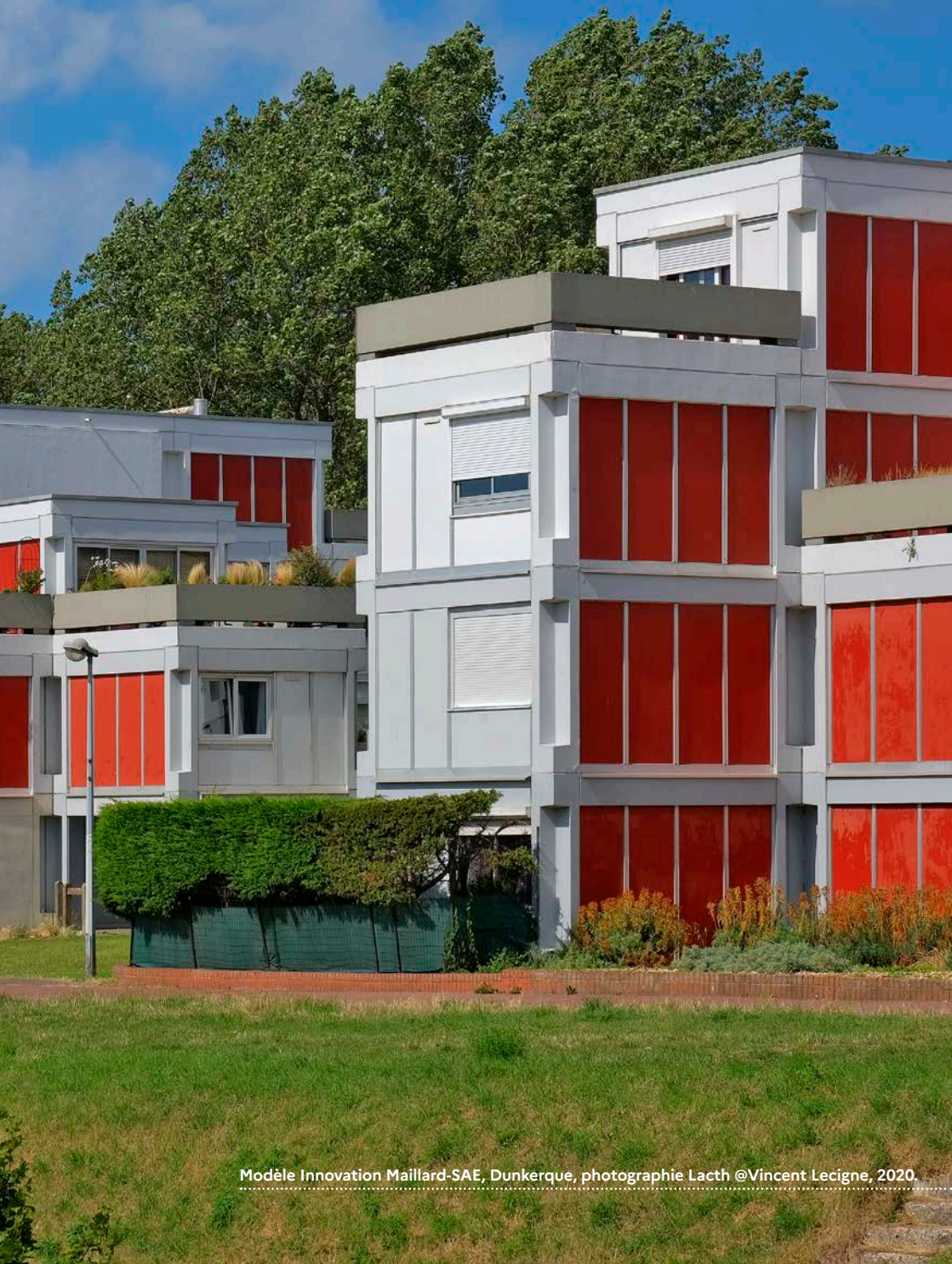
Modèle Innovation Maillard-SAE, Dunkerque, 2020.