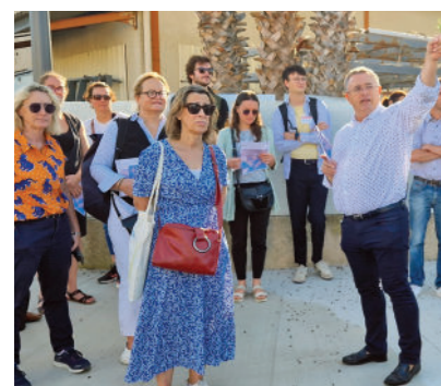
Atelier des Territoires Flash de Torrelles

Identification d'un diagnostic du territoire partagé Production collective d'un scénario d'aménagement