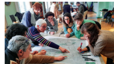
Atelier d'inspiration France Villes et territoires Durables à Marseille

La journée débute par une mise à jour sur les nouveaux enjeux environnementaux et la présentation illustrée de méthodes pour adapter vos politiques publiques. Les membres experts de l'association se déplacent pour présenter outils et réalisations inspirantes.