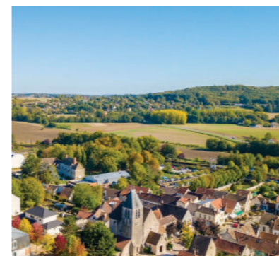
La reconversion de la friche industrielle du Pont des Gains en ÉcoQuartier à Breuillet

PARTICIPATION CITOYENNE ET LA CO-CONSTRUCTION tout au long du projet, axe majeur de la réussite d'un ÉcoQuartier.