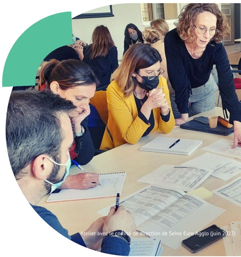
Atelier avec le comité de direction de Seine Eure Agglo (juin 2022)

Ecrire un nouveau récit urbain conjuguant qualité paysagère, adaptation au dérèglement climatique, nouveaux usages sur des espaces publics apaisés.