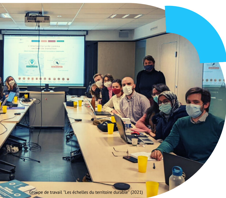
Groupe de travail "Les échelles du territoire durable" (2021)

Les outils de normalisation, certification et labellisation : comment y voir clair dans le méandre des normes, certifications et labels et sur quels outils solides s'appuyer ? Avec l'appui de Bruno Bessis (DGALN) et Alain Lecomte (Personnalité qualifiée FVD). 1 réunion le 10/06. Valorisation des livrables sur le Portail France Ville Durable : rapport réalisé par le cabinet Icare, avec des fiches pédagogiques qui détaillent très précisément les objectifs et les modalités pratiques d'une douzaine d'outils et démarches de certification, labellisation et normalisation. Poursuite des travaux en 2023 sur la mise à jour des livrables, la réalisation d'une enquête pour recueillir les besoins des collectivités et des entreprises ainsi que d'un parcours "média" pédagogique.