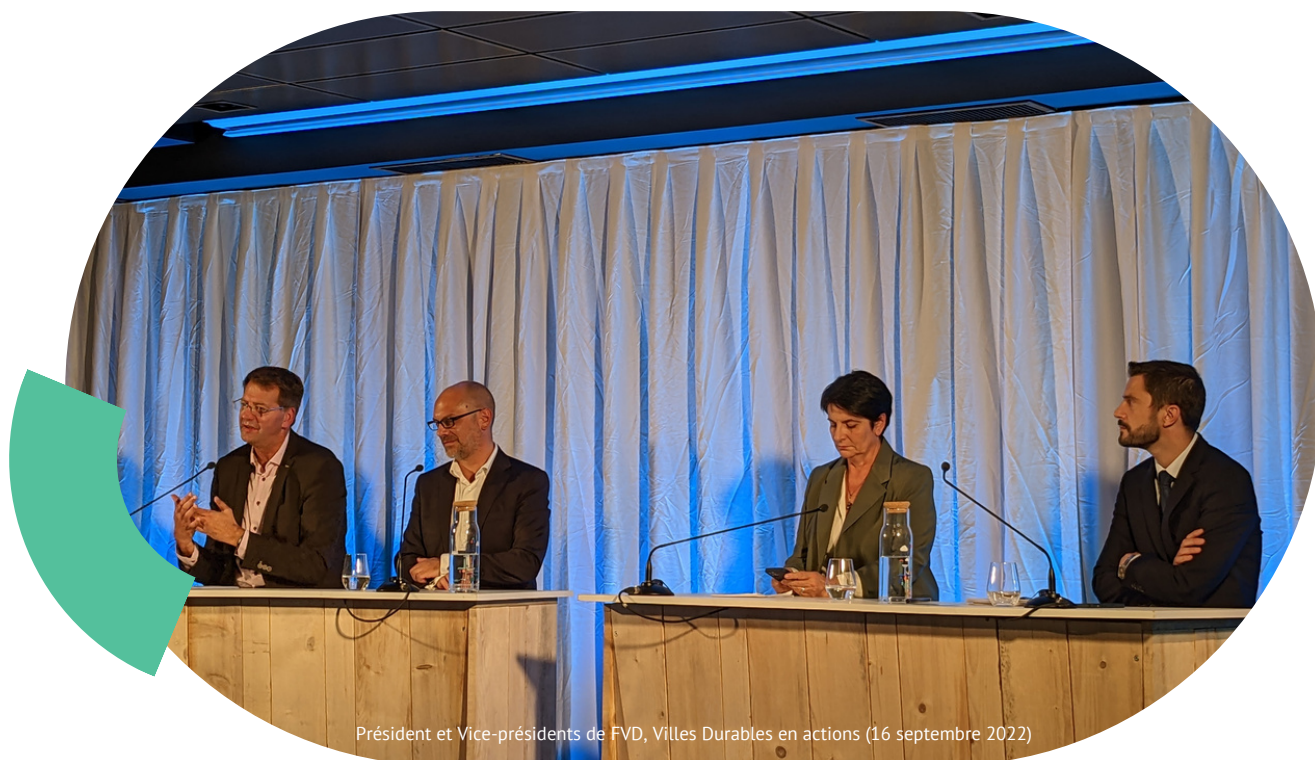
Président et Vice-présidents de FVD, Villes Durables en actions (16 septembre 2022)

Livraison des dernières briques du portail France Ville Durable : Espace adhérents et plateforme replay pour permettre aux membres un accès sécurisé et centralisé à tous les contenus utiles, y compris les formations, webinaires et groupes de travail accessibles en ligne.