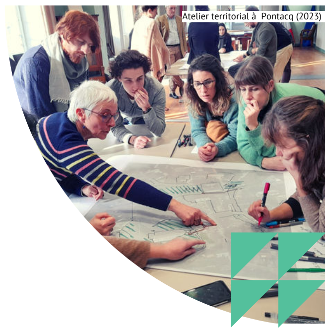
Atelier territorial à Pontacq (2023)